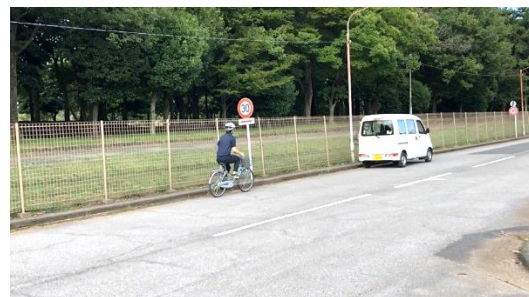
実演動画(駐停車車両の側方通行)