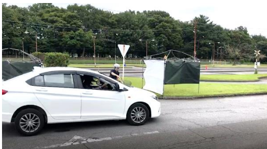
実演動画(見通しの悪い交差点)