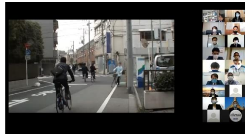
実演発表(ディスカッション)